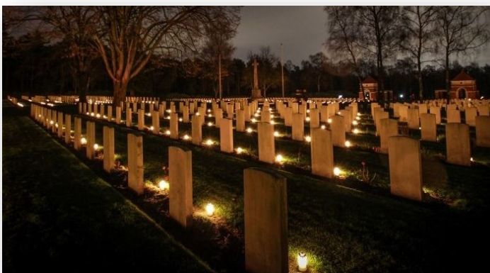
Canadian War Cemetery in Holten, waar 1355 gesneuvelde Canadese soldaten zijn begraven. Elk jaar worden op kerstavond door schoolkinderen kaarsen op de graven gezet.

Er is veel animo in het land. Het Winnipeg Symphony Orchestra heeft zijn naam mee en doordat het in het kader van 75 jaar bevrijding is, zijn er veel subsidiepotjes beschikbaar. Inmiddels hebben we op zeven opeenvolgende dagen zeven concerten gepland in zeven verschillende steden, waaronder op 4 mei in het Concertgebouw in Amsterdam en op 5 mei in De Doelen in Rotterdam.