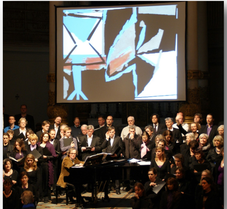
'Nunc et in hora mortis nostrae I' klankrepetitie in De Duif