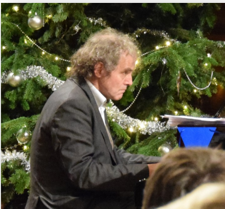
Serata musicale op 17 december 2018