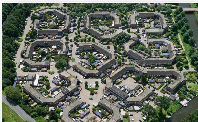
Bloemkoolwijk Almere Haven

Het oudste stadsdeel van Almere, Almere Haven, werd opgezet als een zogenaamde bloemkoolwijk. Deze term wordt gebruikt voor buurten met kronkelende paden en hofjes met vaak maar één toegangsweg. Er zijn weinig doorgaande wegen en de zijstraten en aldus ontstane woonerven vormen aparte subwijken. Van bovenaf gezien zou je, met enige fantasie, de gelijkenis met een bloemkool kunnen zien.