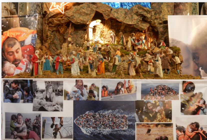
De 'presepe' (kerststal) in de kerk Gesù Nuovo in Napels verbond in 2016 de geboorte van Christus ook met het lot en leed van de vluchtelingen