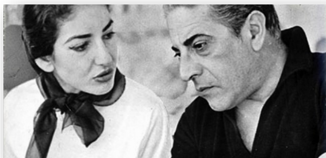
Maria Callas en Aristoteles Onassis