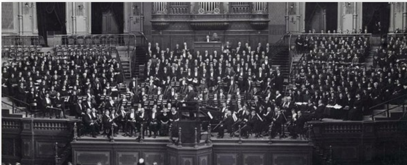
Toonkunstkoor Amsterdam in 1916

In december 2017 signaleerde NRC Handelsblad - 'Kerst, Pasen - ontkerkelijkt Nederland viert de feestdagen met Bach' - dat het Weihnachtsoratorium bezig is aan een opmars. Met onze aanstaande uitvoering volgen we deze trend én krijgt onze uitvoering van de eerste drie Weihnachtscantates een eigen karakter door de toevoeging van het voor ons geschreven Reminiscent van Egon Kracht.