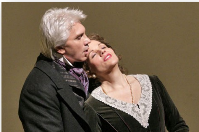
Dmitri Hvorostovski en Renée Fleming in 'Jevgeni Onegin'

Het zijn niet de geringste orkesten, dirigenten en solisten die eraan meewerken. Zowel The Metropolitan Opera als het Royal Opera House hebben zelf een uitstekend orkest en