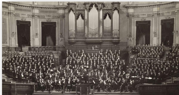
Een uitvoering van de Matthäus Passion door Toonkunstkoor Amsterdam en het Concertgebouworkest olv Willem Mengelberg