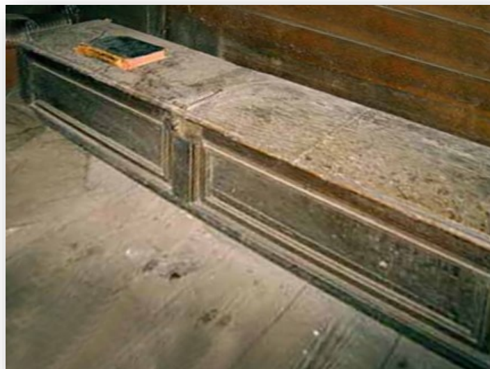
De partituur van de Messe Solennelle op de kist waarin hij werd gevonden