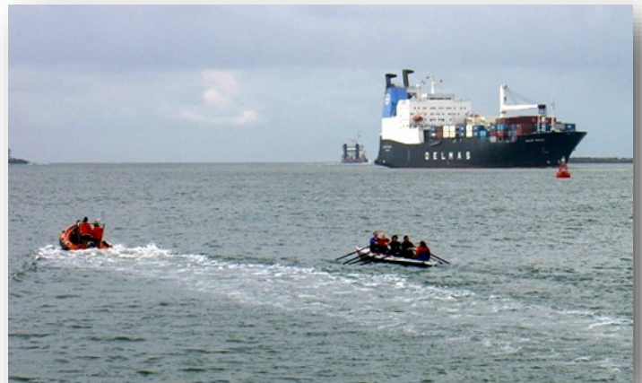
De zeeroeiboort 'The Vin' vaart bij IJmuiden het zeegat uit

Ik heb meegeroeid met KiKaRoW 2005: een estafettesponsortocht voor Stichting KiKa over zee tussen Nederland en Groot-Brittannië. Na een jaar van collecteren, sponsoren zoeken en heel veel trainen, zijn we met een groep roeiers in een paar dagen en nachten op en neer geroeid over de Noordzee. Het meest spectaculair was om 's nachts onder de sterrenhemel te varen en door de soms hoge golven te steken. Het project heeft voor het onderzoek naar kinderkanker een paar ton opgeleverd en het was voor alle roeiers een onvergetelijke ervaring.