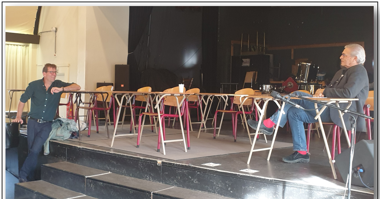
Op zaterdag 2 oktober bezocht Harry van der Kamp de repetitie van Toonkunstkoor Amsterdam. Van der Kamp, die onder meer wereldwijde bekendheid geniet als bas-bariton, documenteerde het complete vocale werk van Sweelinck en zette het op CD met het door hem opgerichte Gesualdo Consort Amsterdam: Het Sweelinck Monument