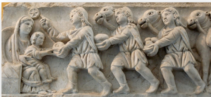
De aanbidding der wijzen op een 4de-eeuwse Romeinse sarcofaag

Ik ben op zoek gegaan naar drie melodieën uit de drie grootste levensbeschouwingen naast het christendom. Dat was een