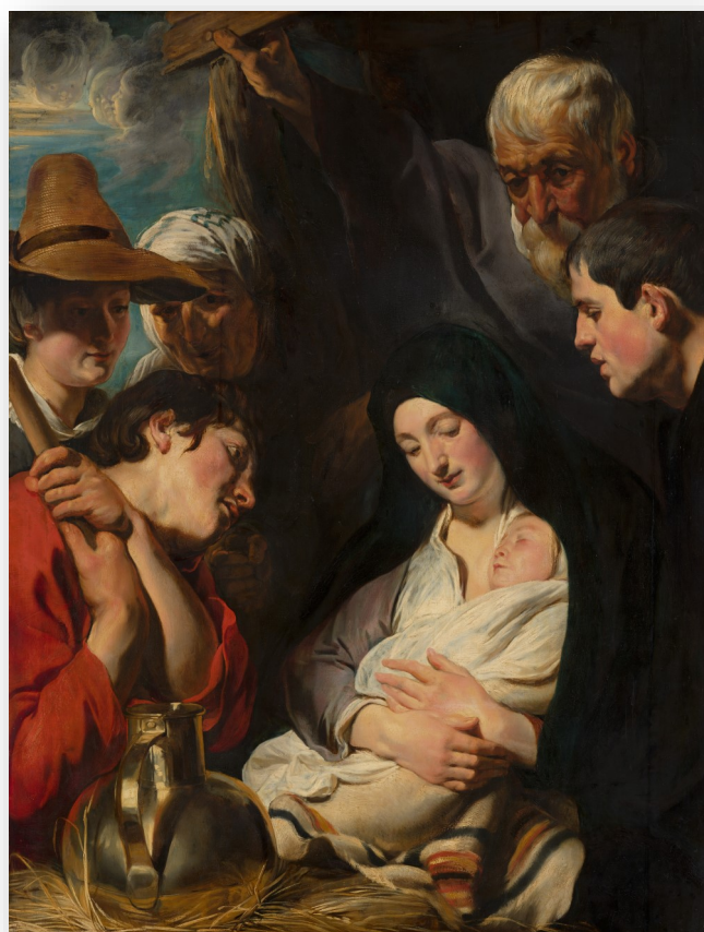
'Aanbidding van de herders' door Jacob Jordaens, olieverf op paneel (125,5 x 96 cm), Mauritshuis Den Haag

Ook in andere landen wordt het bijbelverhaal van Lucas bezongen in de kersttijd. Misschien omdat de herders, mensen die met hard werken hun brood verdienden, zo veel dichterbij ons staan dan die drie onbekende koningen of wijzen, waarvan niemand precies wist waar ze vandaan kwamen en waar ze uiteindelijk zijn gebleven.