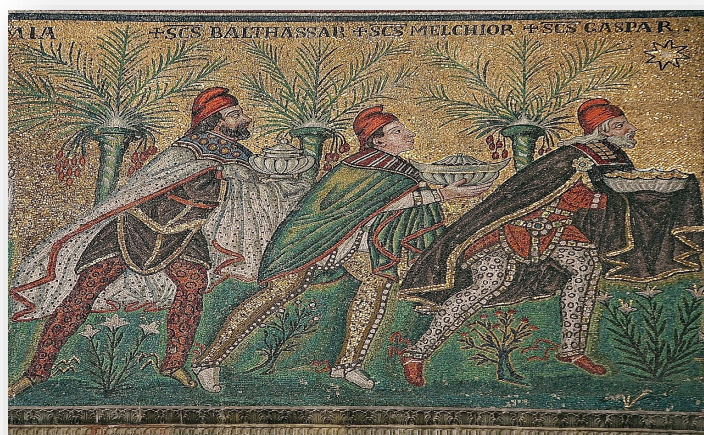
De wijzen uit het oosten afgebeeld als Perzen op een Byzantijns mozaïek uit de 6de eeuw in de San Appolinare in Ravenna

bijzondere exercitie. De melodieën hebben vaak heel verschillende toonzettingen en laten zich moeilijk combineren. Toch is het mijn doel deze 'wijzen' met elkaar in harmonie te brengen.