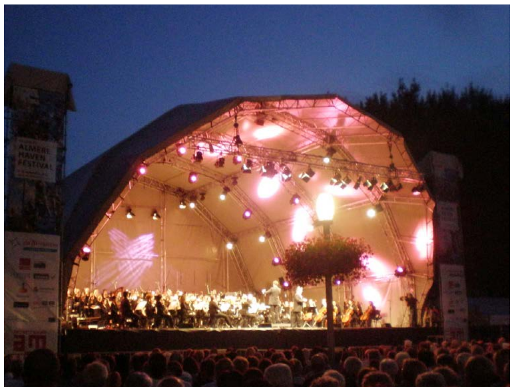
Het podium van het Havenfestival in Almere - met verlichting.