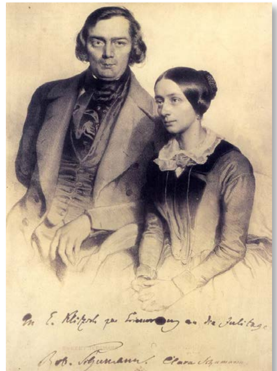
Robert en Clara Schumann