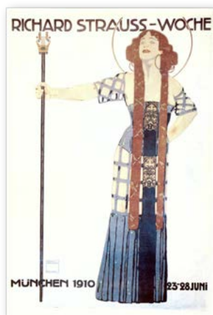
Klytämnestra op de poster voor de eerste Richard- Strauss-week van München in 1910, ontworpen door Ludwig Hohlwein.

dirigerende Richard Strauss, door Eduard Grützner, 1912