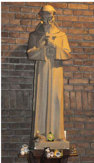
De heilige Franciscus van Assisi. Zijn feestdag op 4 oktober werd Wereld-dierendag. Dit beeld - met dierenfoto's - staat in de Vredeskerk.

en was begin augustus 1924 al voltooid. De parochie bloeide en groeide; aan weerszijden van de kerk werden een broeder- en een zusterklooster gebouwd, een meisjes- en een jongensschool, alsmede een verenigingsgebouw (Huize Pax, nu een hotel). Heel de buurt ademde een katholieke geest en kreeg dan ook de bijnaam Papendorp. De buurt waarin de kerk staat, was zeer kinderrijk. Uit elk portiek kwamen iedere morgen tot wel zo'n dertig kinderen tevoorschijn, op weg naar school. Op de zondagen bezochten gemiddeld vijfduizend mensen een van de vijf missen.