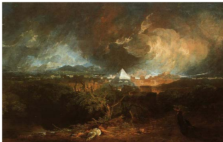
William Turner - De vijfde plaag van Egypte, 1800

Om aan goedkoop veevoer te komen om ons hier, in het rijke westen, van volle barbecues te voorzien, worden in verre landen op grote schaal bossen gekapt en worden kleine boeren onteigend. De mensen kunnen zich tegen deze megabedrijven (en de meewerkende corrupte overheden!) niet verweren en er wordt op grote schaal honger geleden. Intussen breken hier, door de intensieve veehouderij, regelmatig epidemieën uit en moeten duizenden, vaak gezonde, beesten worden 'geruimd'. Zelfs hobbykippen ontkomen niet aan dit lot.