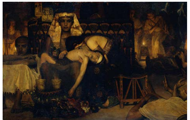
Lawrence Alma Tadema - Dood van de eerstgeborene, 1872

mishandeling en uitbuiting komen nog steeds op zeer grote schaal voor. Omdat wij hier niet te veel geld willen uitgeven voor onze hippe kleding, worden kleine kinderen voor een schijntje te werk gesteld in donkere en ongezonde ateliers ver weg. In China worden veel pasgeborene meisjes – de eerstgeborenen – vanwege de strenge één-kindpolitiek simpelweg gesmoord of te vondeling gelegd. In landen met oorlogsgeweld worden kinderen geronseld voor het leger en in veel arme landen worden meisjes en jongens verkocht om als prostituee te gaan werken. Hulpgoederen voor vluchtelingen worden door niets ontziende bendes gestolen. En als ik zeg 'het hofnarretje', dan weet iedereen wat ik bedoel.