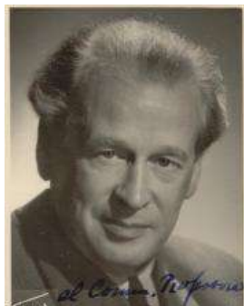
Paul van Kempen

Tussen het publiek had zich een aantal tegenstanders verzameld en als het concert begon, brak de hel los. Er werd geschreeuwd en vuurwerk afgestoken, het Horst Wessellied werd ingezet. Nadat de onruststokers de zaal waren uitgezet, werd de uitvoering hervat en ondanks enkele incidenten tot een goed einde gebracht. Paul van Kempen, solisten, koor en orkest wachtten een ovatie. Bij de uitvoering op zondag herhaalden zich de rellen en een deel van het orkest zei zo niet te kunnen spelen en verlieten de zaal. Het concert werd afgelast. Paul van Kempen kreeg bij het verlaten van de zaal van het koor een staande ovatie.