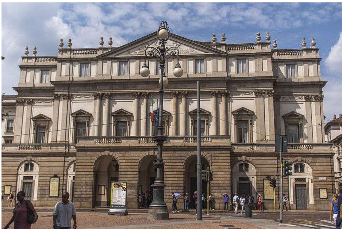
La Scala – Milaan