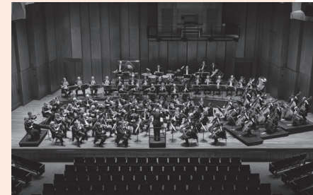
Noord Nederlands Orkest