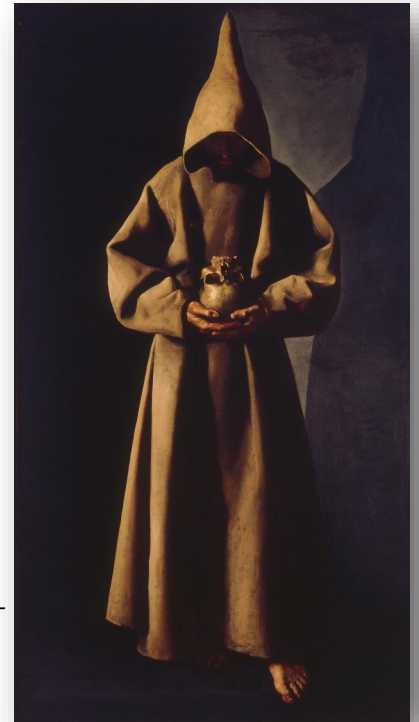
Francisco de Zurbarán 'Franciscus met doods- hoofd', het schilderij dat Henderickx inspi- reerde

het koor in de stille zaal is als een pulsatie." Naast de vier visioenen en de drie extases zijn er een proloog en een epiloog. 'Song of Memories' en 'Song of Compassion' vormen twee interludes tussen de visioenen en de extases.