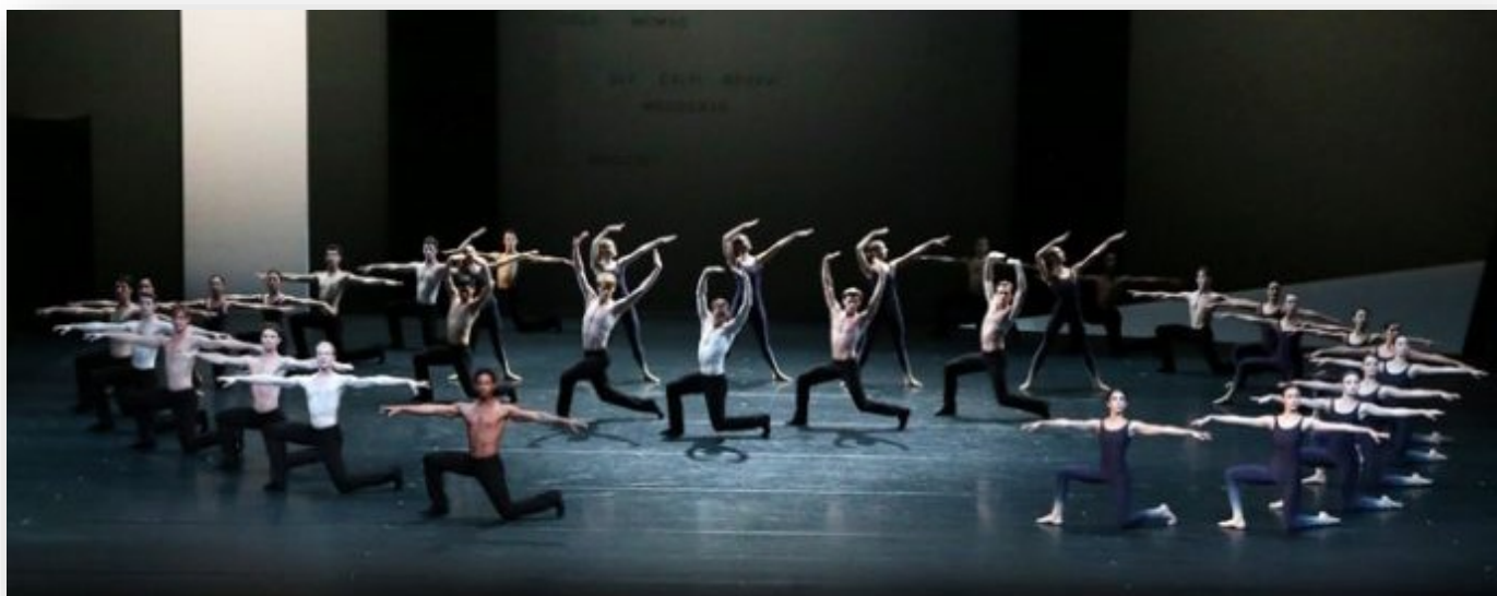
Toneelbeeld uit het 'Requiem' van Toer van Schayk. Klik hier voor repetitiefragment.