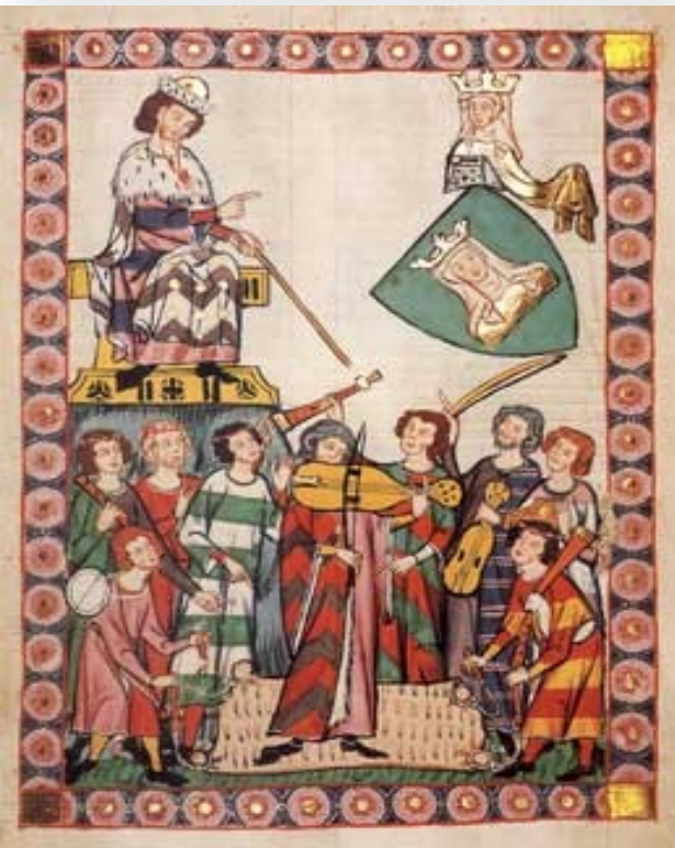
Illustratie uit het Manessische Liederhandschrift