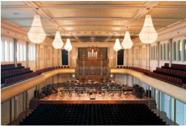
De grote zaal

begin 21ste eeuw, is dit gegeven een van de uitgangspunten. Hierbij is de Grote Zaal volledig gerestaureerd, is er een nieuwe Kleine Zaal gebouwd (de vorige dateert van de verbouwing in de zeventiger jaren) en zijn oud- en nieuwbouw met elkaar verbonden door een Foyer.