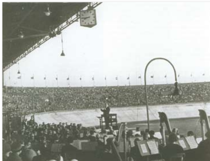
Het stadionconcert, precies 75 jaar geleden!

Dat was niet onze 'grootste' uitvoering; in juni 1934 zong TKA met drie andere koren, een driedvoudige solistenbezetting en het gecombineerde Concertgebouw- en Residentieorkest onder leiding van Willem Mengelberg een monsteruitvoering in het Olympisch Stadion! Voor 30.000 toehoorders werd een Stadionconcert gegeven ten bate van de beide in financiële nood verkerende orkesten. Peter van Anrooy dirigeerde voorafgaand zijn Piet Hein Rapsodie.