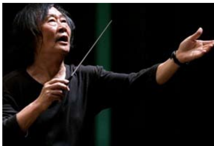
Ken Ichiro Kobayashi