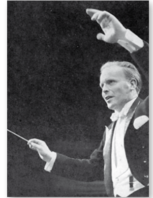
Willem van Otterloo