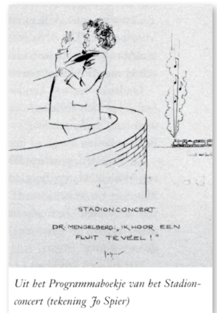
Uit het Programmaboekje van het Stadionconcert (tekening Jo Spier)

Onze allereerste uitvoering van Beethoven's laatste symfonie stamt al uit 1840. Tijdens het derde Algemeen Muziekfeest van de Maatschappij werd in de Lutherse kerk aan de