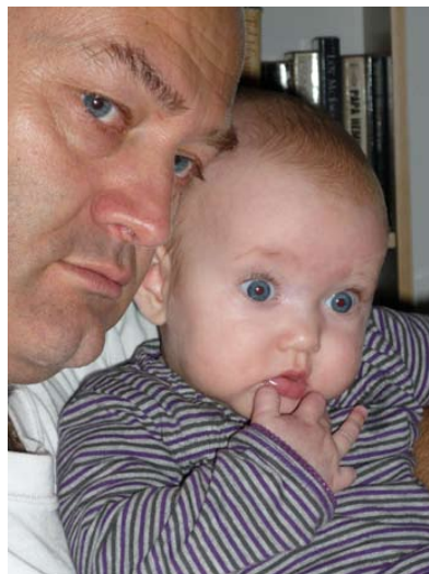
‘Josephine weet het zo net nog niet met die Arvo Pärt’