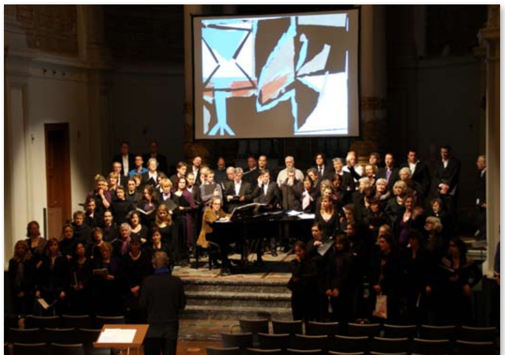
Generale repetitie van Nunc 1, februari 2010

Het centrale werk in deze serie is het Via Crucis van Franz Liszt dat elk jaar wordt uitgevoerd. Een paar delen worden door het hele koor uitgevoerd en andere delen worden door kleine koren gezongen. Deze afwisseling versterkt de emotie en dimensie in dit doordringende werk over de kruisgang van