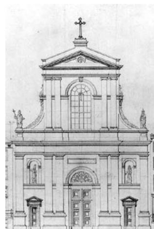
links de gevel, rechts de presentatietekening van Molkenboer, 1857