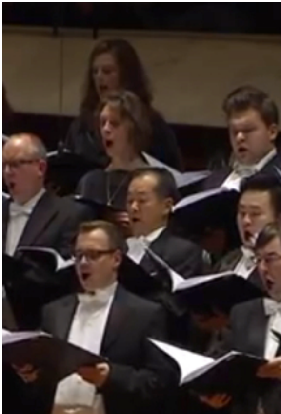
The Bells, door Rundfunkchor Berlin op YouTube

O.l.v. Sir Simon Rattle, opgenomen in de Berlin Philharmonie, 12 september 2010