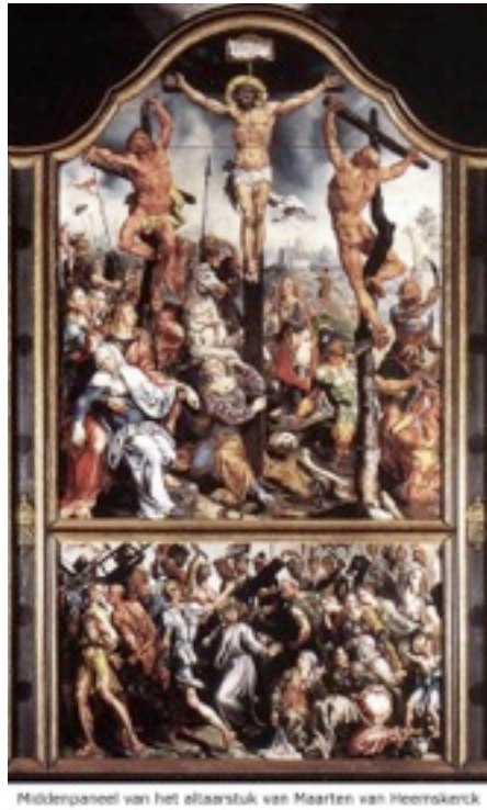
Middeelpaneel van het altaarstuk van Maarten van Heemskerck

In de kooromgang hangt aan de noordzijde een modelscheepje uit 1667. Het is een schaalmodel van een driemaster en herinnert aan de slag bij Chatham in juni 1667 door de oorlogsvloot van de Republiek der Zeven Verenigde Nederlanden onder bevel van Michiel de Ruyter. Doordat de Nederlandse schepen de ketting stukvoeren, die door de Engelsen als barricade was aangebracht in de rivier de Medway, konden zij opvaren tot Chatham, sinds 1560 de belangrijkste Engelse marinebasis. Zij brachten diverse schepen tot zinken en maakten onder meer het vlaggenschip HMS Royal Charles buit, dat ze meesleepten naar Nederland. Deze slag leidde tot een snel einde van